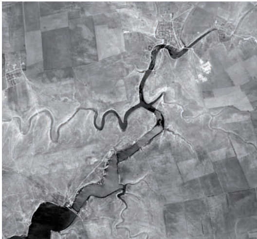
Рис. 3. Верховья оз.Донузлав.

Озеро Донузлав – самое протяжённое и глубоководное из озёр Западного Крыма, вытянуто с юго-запада на северо-восток. По происхождению озеро лиманное, образовалось в результате затопления морем обширной балочной системы (Соколов, 1964). Опреснённый участок начинается от Аблимицкого моста и занимает всю северо-восточную часть озера (рис. 3). Его общая площадь, по нашим данным, – 420 га. Ширина