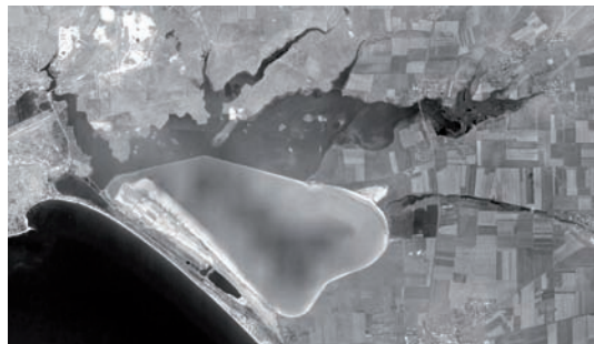
Рис. 2. Озеро Сасык-Сиваш.