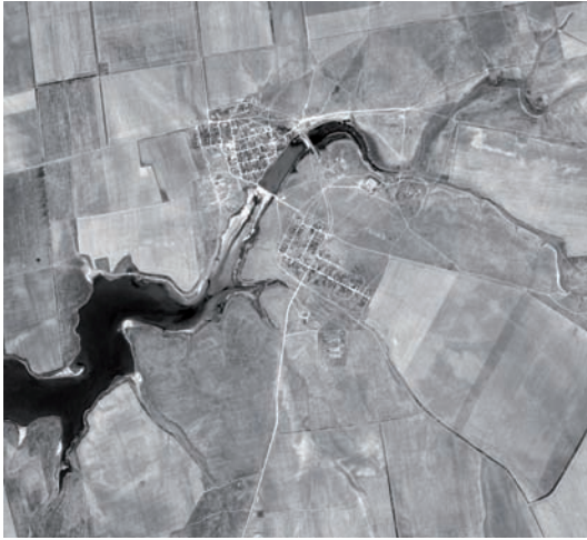
Рис. 4. Пресная часть оз. Джарылгач.

Озеро Джарылгач – самый западный из рассматриваемых водоёмов, также лиманного происхождения. Пресная часть находится у восточной окраины озера и занимает небольшую площадь (9 га; рис. 4). Озеро здесь мелководно, берега пологие, акватория практически полностью заросла тростником, местами на побережье образуются заболоченные луговины. Видовой состав птиц относительно беден: лебедь-