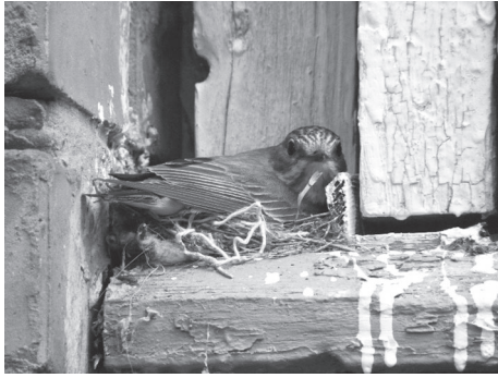
Рис. 2. Гніздування мухоловки сірої за лиштвою підвіконня.

Fig. 2. Nesting of the Spotted Flycatcher behind window aprons.