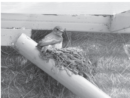
Рис. 6. Гніздування мухоловки сірої у гнізді ластівки сільської на студентській їдальні у навчально-спортивному табо- рі «Гайдари».

Fig. 5. Nesting of the Spotted Flycatcher on an electric service panel.