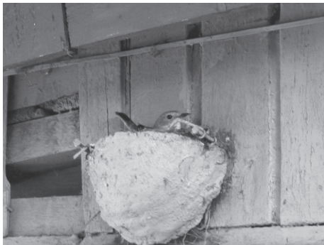
Рис. 1. Гніздування мухоловки сірої у штучних цементно-тирсових гніздівлях.

Особливий інтерес викликає гніздування мухоловок сірих у штучних цементно-тирсових гніздах, які мають форму гнізда ластівки сільської (рис. 1). У 1976 році на території навчально-спортивного табору «Гайдари» було розвішано 20 таких штучних гнізд, заселеність яких досягала 80-90% (Надточий, Зиоменко, 1989). Взимку – навесні 2010 року нами було розміщено ще 15 гніздівель, які успішно заселялись мухоловками сірими. Протягом останніх 35 років в районі дослідження такі штучні гніздівлі є основним місцем розмноження дрібних горобцеподібних птахів, зокрема, і мухоловки сірої (34.65%, N=101 (табл.1)). Успішність гніздування мухоловки сірої у цементно-тирсових гніздах складає у середньому 85%. Такі штучні гнізда мають високий рівень термоізоляції, значний