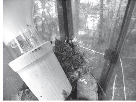
Рис. 3. Гніздування мухоловки сірої у електричному ліхтарі.

Fig. 2. Nesting of the Spotted Flycatcher behind window aprons.