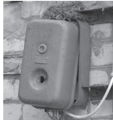
Рис. 5. Гніздування мухоловки сірої на електричному щитку.

Fig. 4. Nesting of the Spotted Flycatcher in a coffee can located in the cafeteria's air vent.